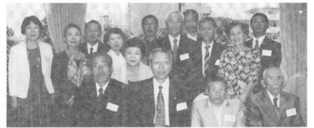
(文責 平田 兼明)