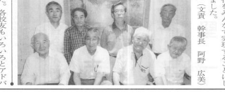
(文責 幹事長 阿野 広美)