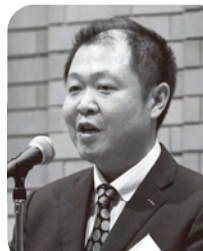
ご挨拶：前野通信教育部教授