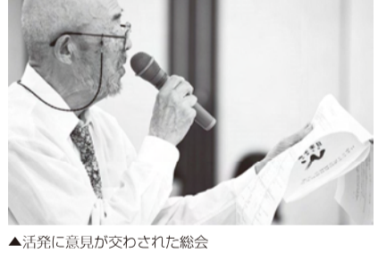
▲活発に意見が交わされた総会