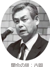
開会の辞：古岡北信越ブロック長