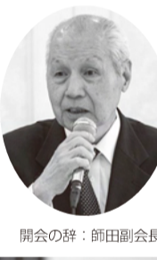
開会の辞：師田副会長