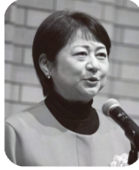
来賓祝辞：松重充浩通信教育部長